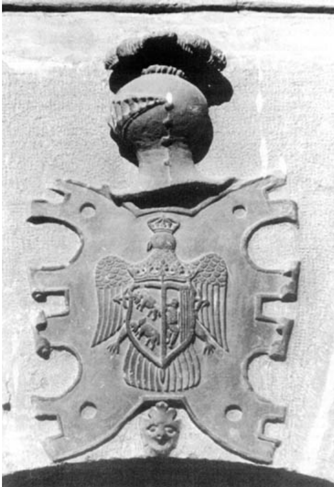
Escudo de Aguilar Ponce de León

Aquel ilustre prócer, se niega a colaborar con el gobierno intruso tomando la resolución de no jurar el cargo de regidor al ser elegido 74 .