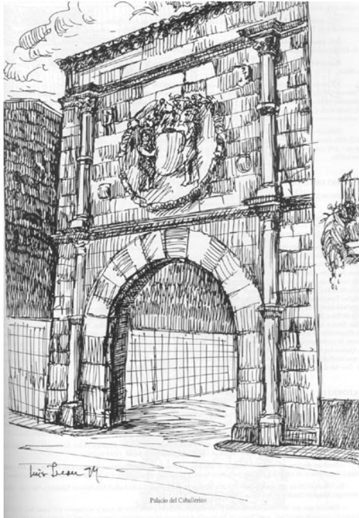
Palacio del Caballerizo