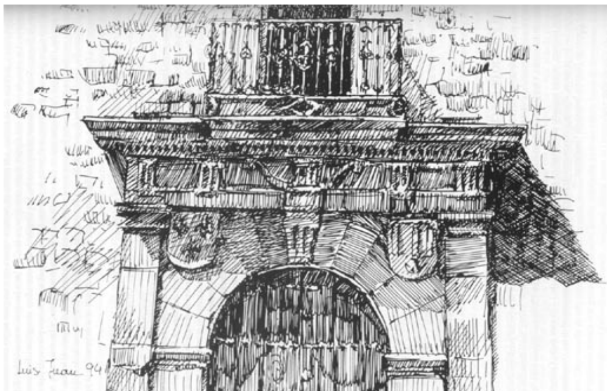
Casa de los Cueva. Plazuela de Josefa Manuel

En su altar se veneró una imagen antiquísima de San Miguel, procedente del Convento de Carmelitas Descalzos de Úbeda. Estuvo dotado de toda clase de ornamentos.