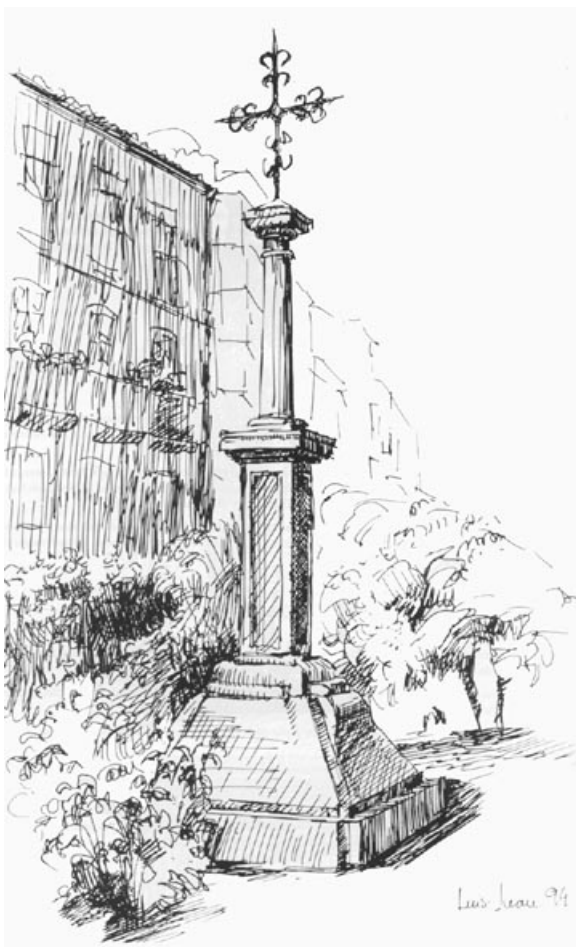
Cruz de Hierro