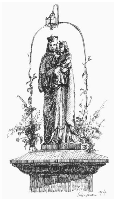
Madre de Dios del Campo