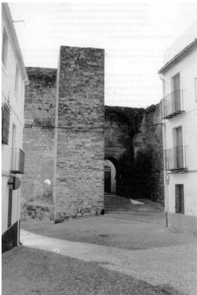
Puerta de Sabiote, libre de edificaciones

Ello consta en el cabildo de 22 de agosto de 1561, y en el celebrado el 5 de septiembre del mismo año dan cuenta que ya había sido derribado.