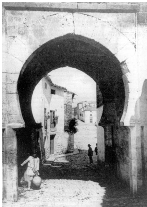
Detalle de Puerta de Sabiote

Libre hoy de edificaciones gracias al desvelo del Sr. Vañó, la Puerta de Sabiote es uno de los monumentos más notables de Úbeda, cuya conservación es excelente.