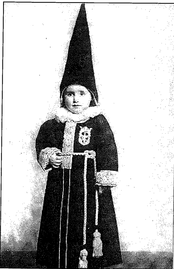
El Viernes santo por la noche la Hermandad del Santo Entierro estrena capirucho de terciopelo.