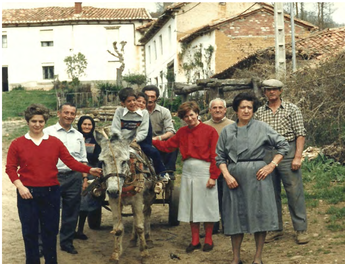
Foto 10. Gentes de Carbajal, h. 1984.