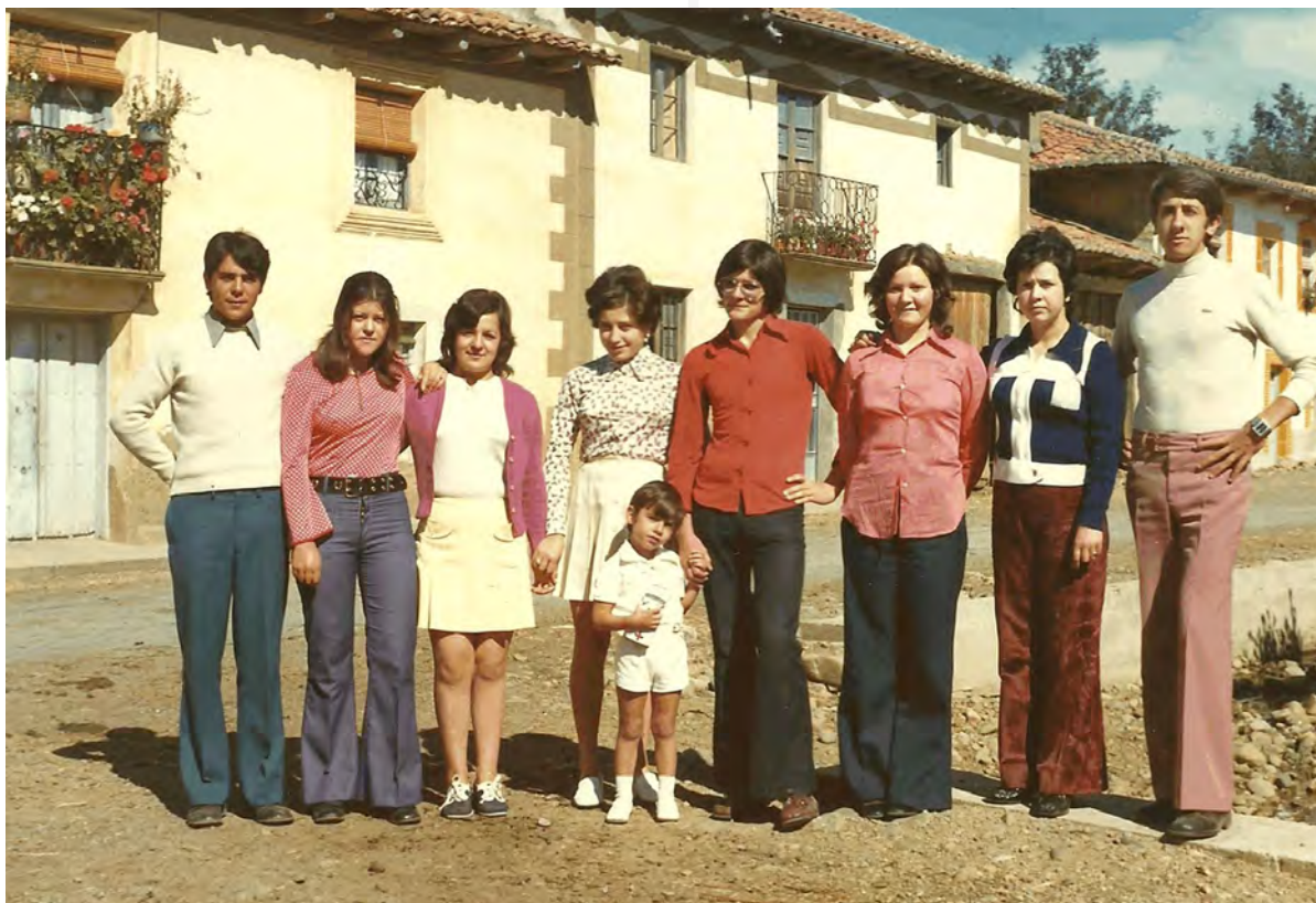
Foto 8. Juventud del pueblo, h. 1972.