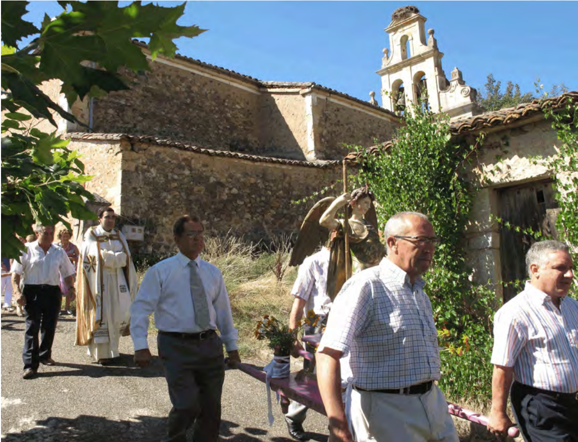
Foto 14. Salida de la procesión de San Miguel, agosto de 2009.