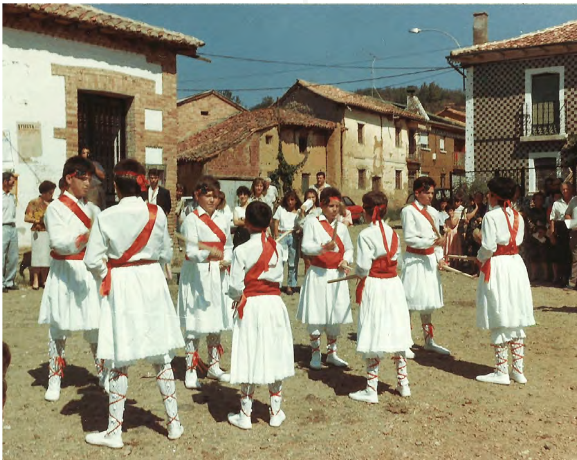
Foto 12. Actuación del «Grupo de Paloteo» de Gradefes en la plaza de la Escuela, a continuación del pregón de la fiesta de la Bendita Peregrina, 12-08-1989.