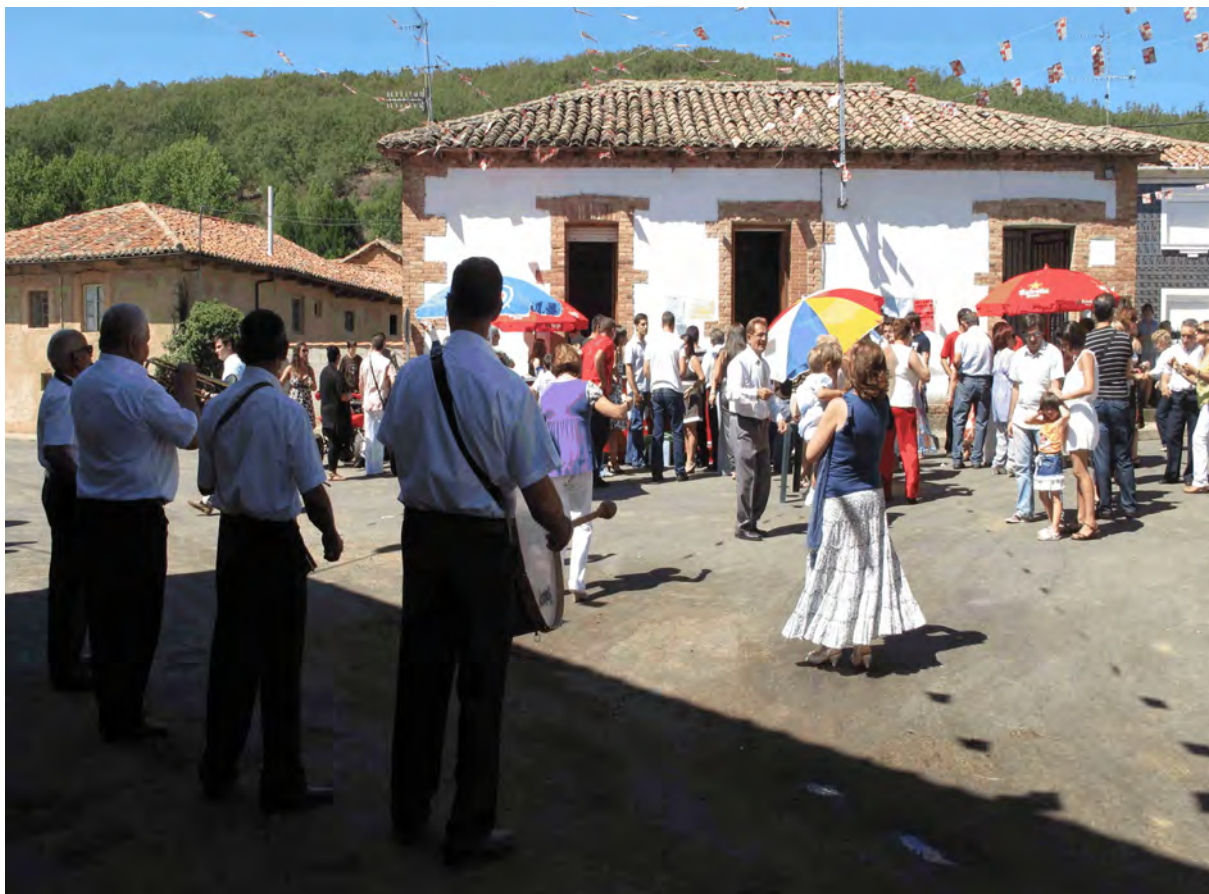
Foto 15. Fiesta de San Miguel en la plaza de la Escuela, agosto de 2009.