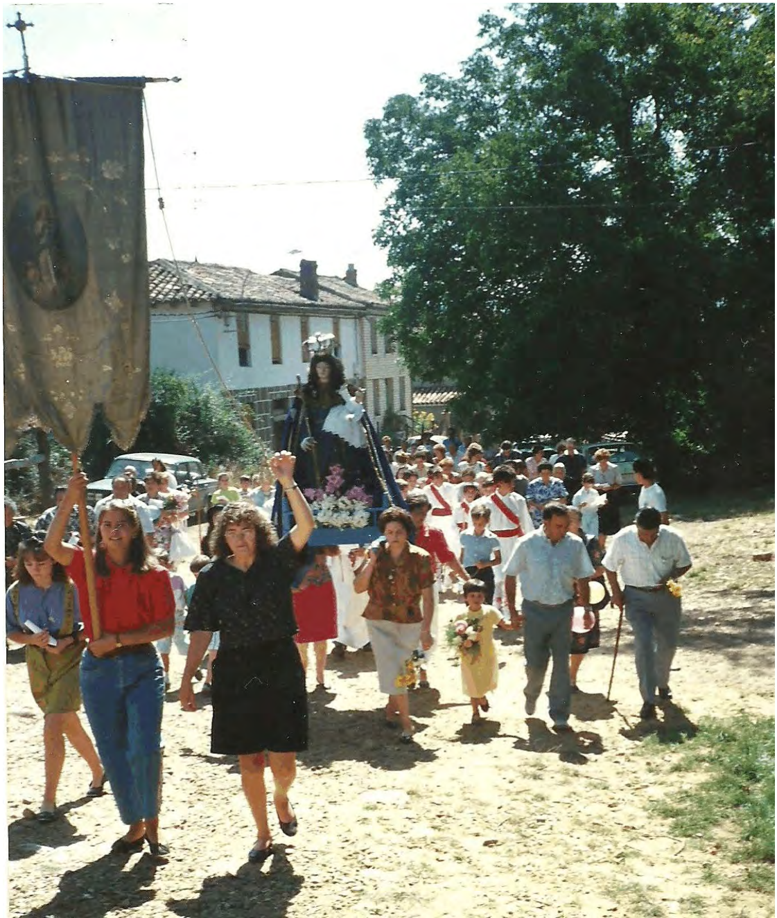
Foto 13. Procesi3n de la Bendita Peregrina, subiendo por la calle Grande, 12-08-1989.