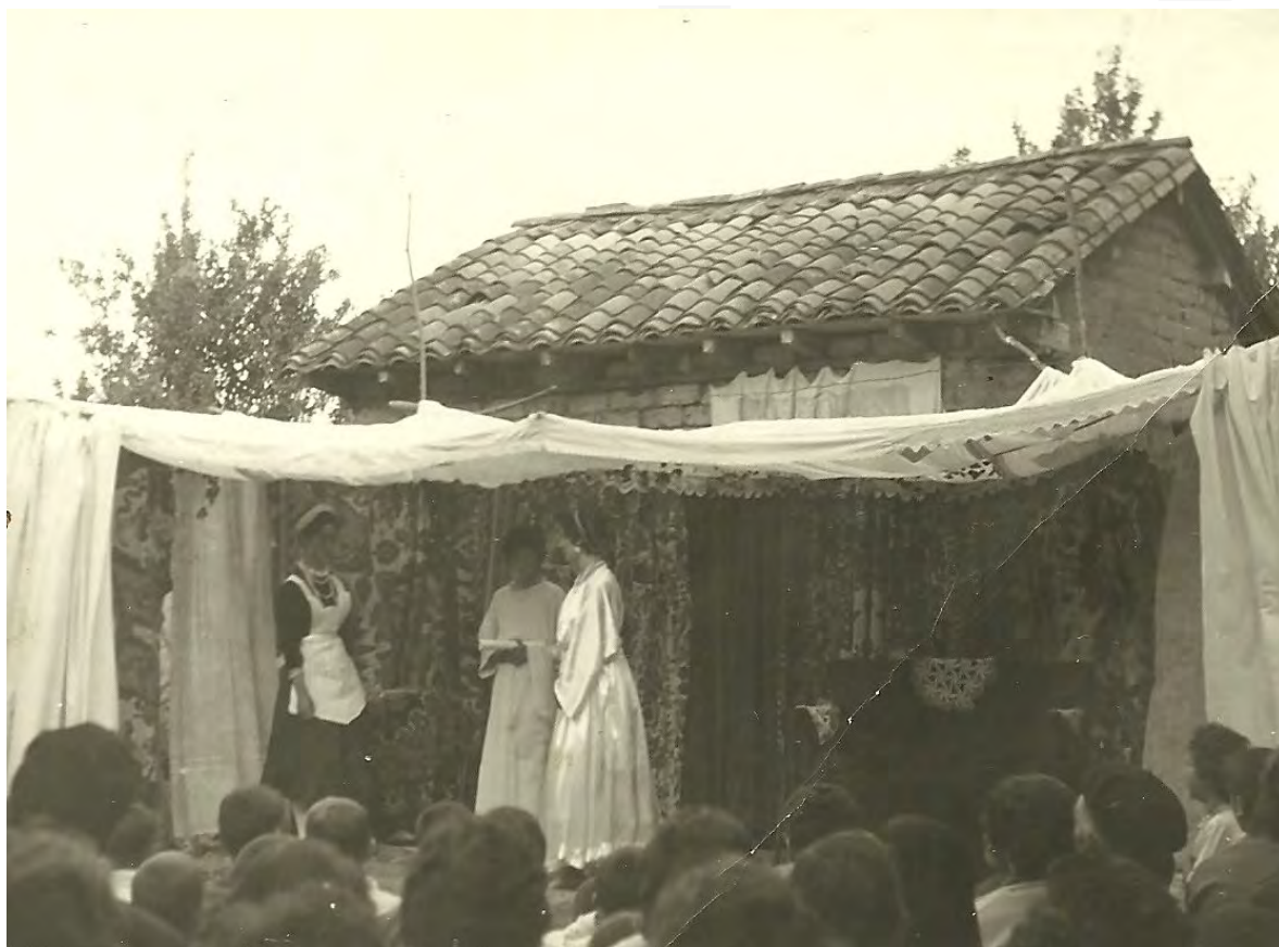
Foto 3. Representación de la comedia Fabiola por las chicas del pueblo, bajo la dirección de la maestra doña Séfora Blanco, en el corral de Miguel Valladares, h. 1956.