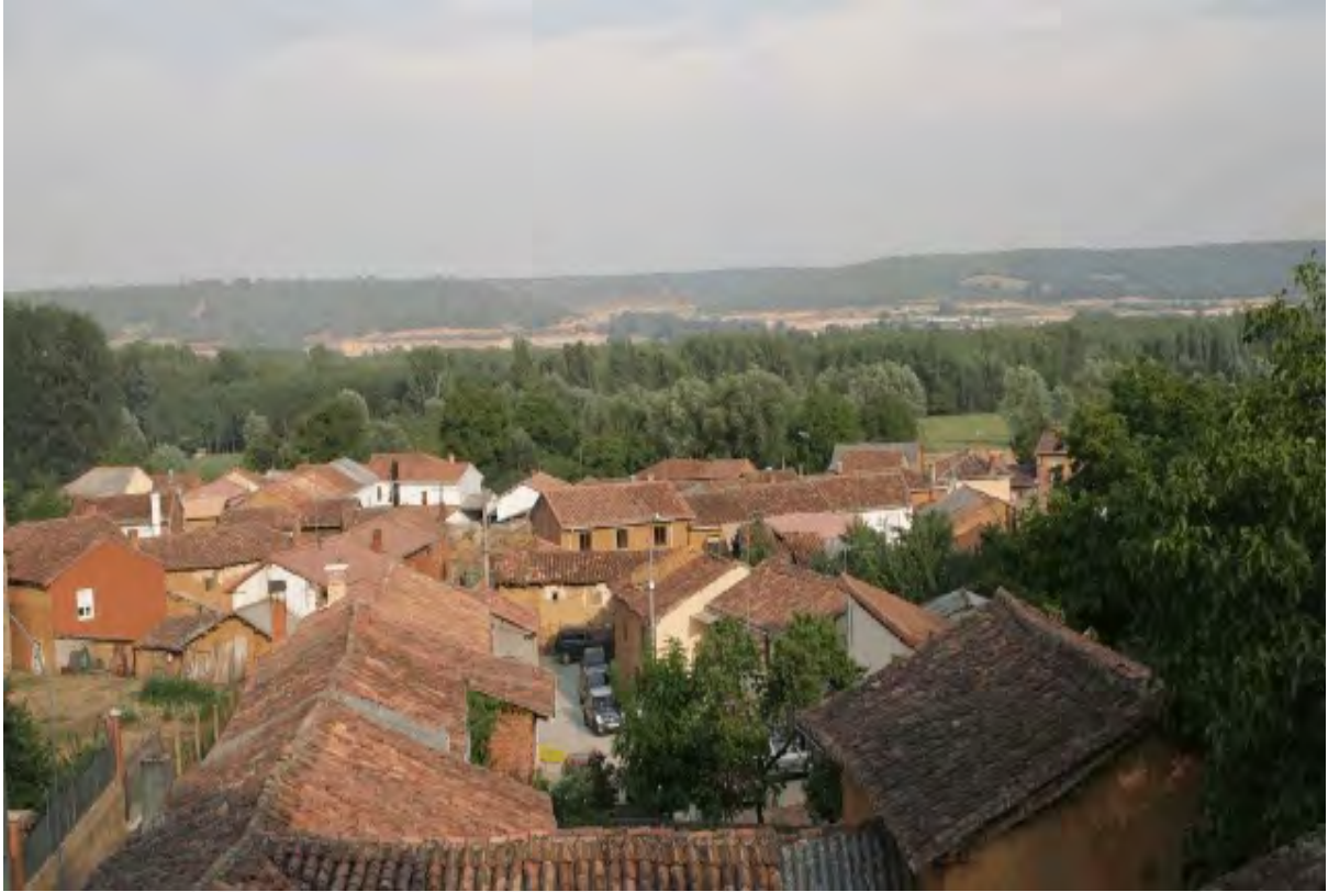
Foto 16. Vista de Carbajal desde el patio de la Iglesia, 11-08-2012.