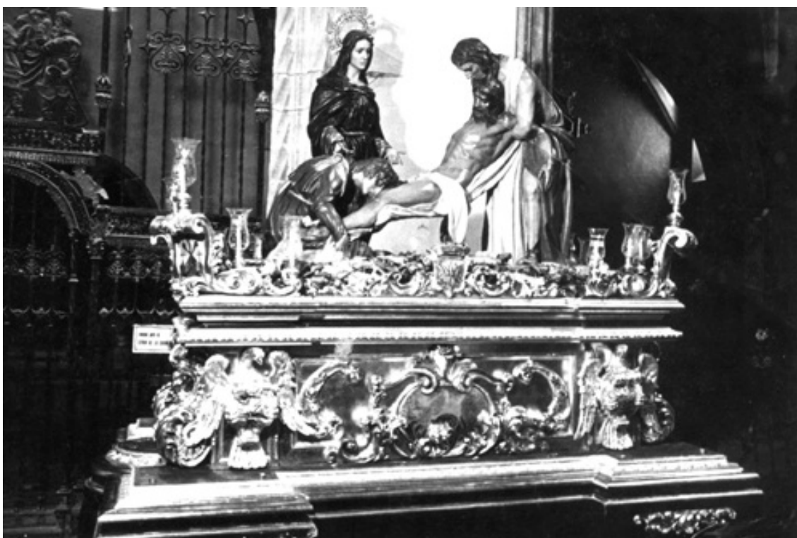
Dejaron de procesionar los Santos Varones en el grupo escultórico, mientras que la talla de la Virgen estrenó una aureola donde se instalaron unas bombillas de tonalidad verdosa...