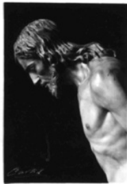
Nuestro Señor en la Columna