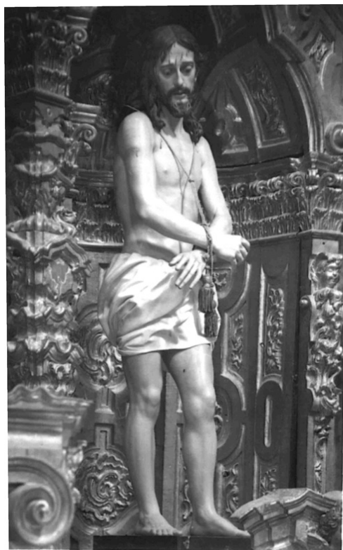
Celebró la hermandad del Santísimo Cristo de la Humildad su fiesta principal, el domingo 27 de febrero en la iglesia de San Miguel Arcángel, colocándose la imagen en una de sus hornacinas...

La segunda junta general que marcaban los estatutos se celebró el día 30 de octubre en el sitio de costumbre. A las once de la mañana se inició la asamblea con la propuesta de un socio, para que la junta