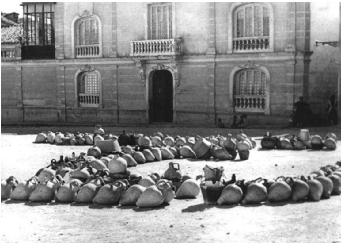
En el mes de septiembre se aprobaría la urbanización de la plaza de San Pedro, colocándose con el tiempo una artística fuente...

a los familiares se le entregaría trescientas pesetas para ayuda de entierro. 537