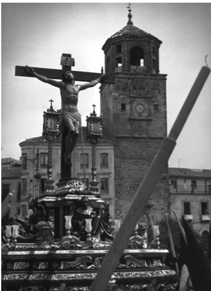
El trono del Cristo estrenó dieciséis artísticas tulipas adquiridas en Madrid. Finalizada la procesión, la imagen de Vassallo fue trasladada a la iglesia de San Nicolás...

sólo lo haría hasta que finalizase la Semana Santa. 577 Seguramente la situación económica por la que atravesaba la hermandad, tuviese mucho que ver en la decisión tomada por su presidente. Las actas reflejan las reiteradas quejas de la junta directiva por la demora que muchos socios tienen a la hora de hacer efectivo tanto las cuotas, como las multas o la adquisición de tela, por eso no es de extrañar que la directiva decidiera en el mes de enero tomar medidas drásticas... 578